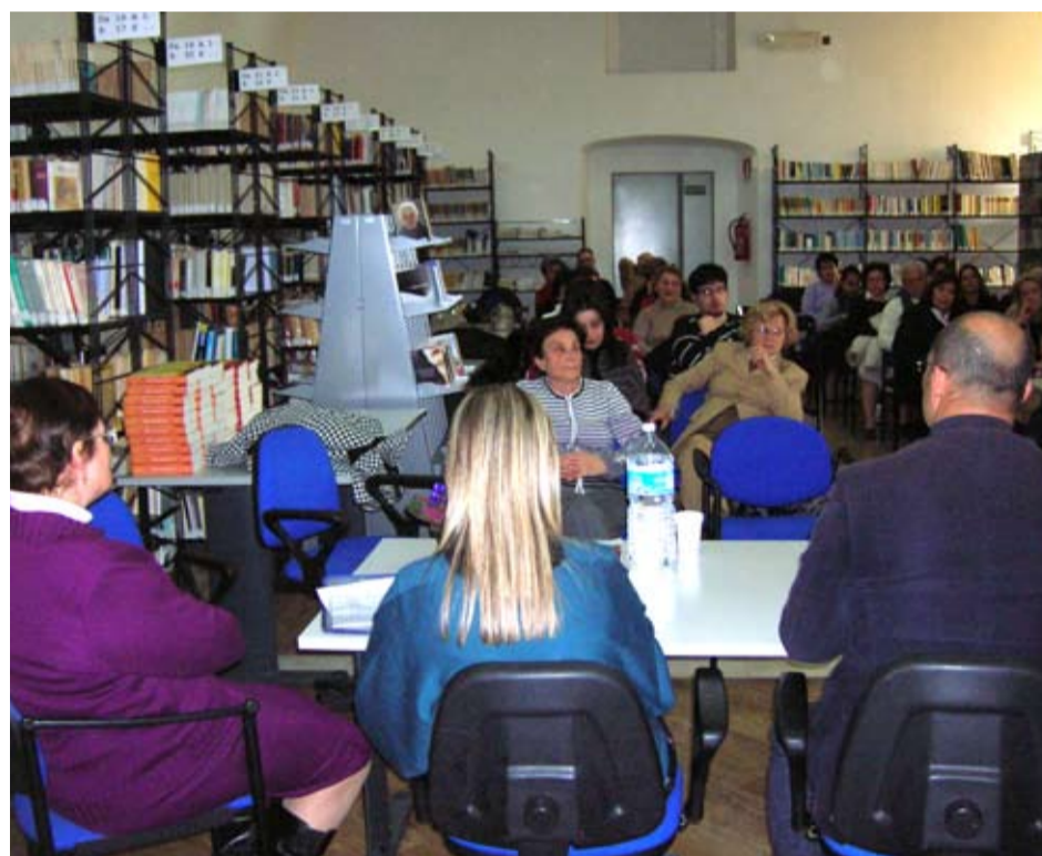
GRUPPO DI LETTURA IN BIBLIOTECA