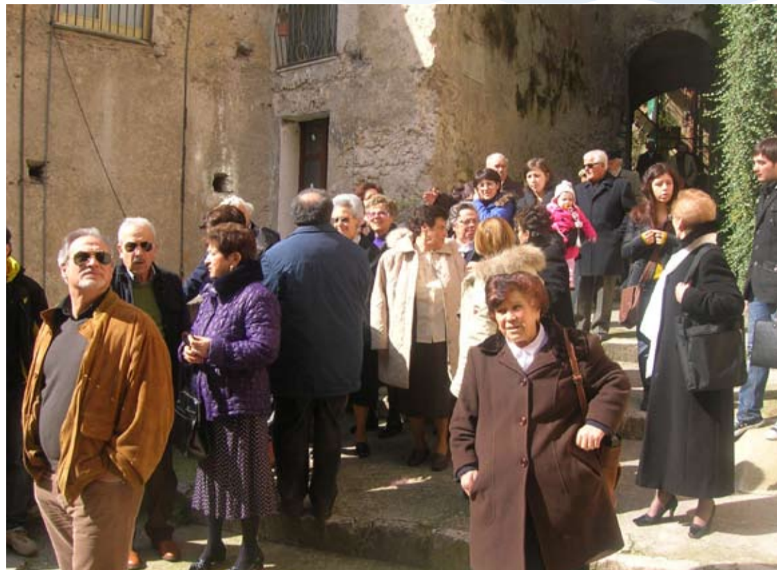
EBOLI, VISITA GUIDATA NEL CENTRO STORICO

Il 28 e 29 marzo la Città di Eboli ha ricor-