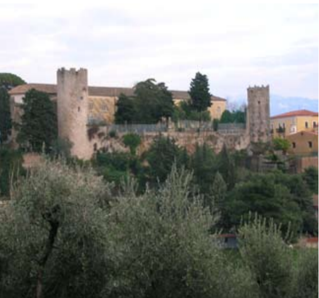
EBOLI, CASTELLO COLONNA