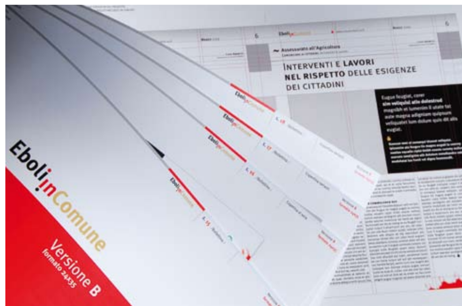
PAGINE DEL MANUALE DI PRESENTAZIONE

realizzeremo una maggiore forma di trasparenza; dall'altro, potremo attuare un vero e proprio coinvolgimento del cittadino verso una partecipazione attiva nelle azioni svolte dal Comune e nelle scelte operate in favore della collettività. 🔥