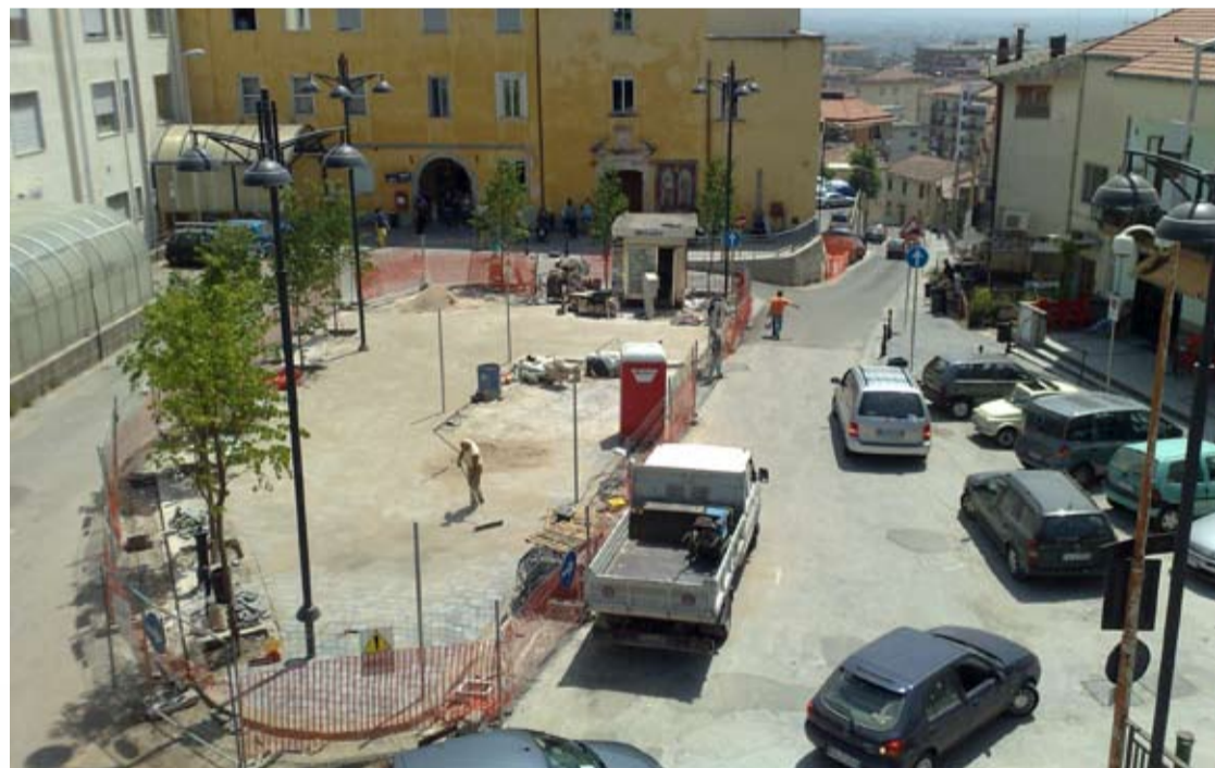
EBOLI, LAVORI DI RIFACIMENTO DI PIAZZA SCUOLA MEDICA SALERNITANA

Infine un importante intervento riguarda infine la manutenzione straordinaria della scuola elementare e materna Cioffi, la cui consegna dei lavori è avvenuta nel mese di maggio. Questi lavori sono