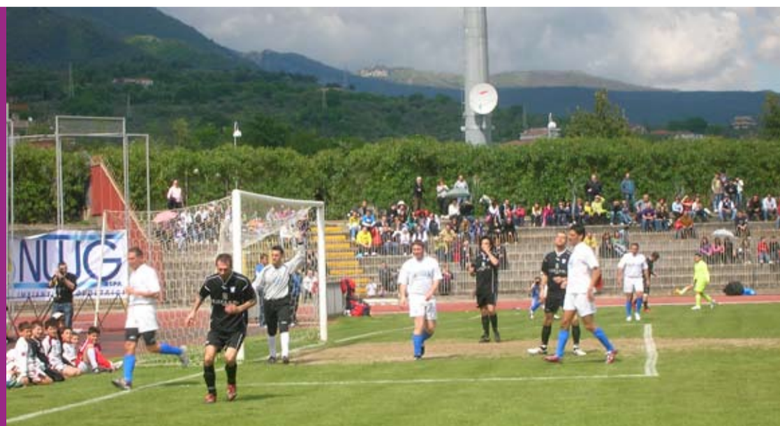
EBOLI, PARTITA DI CALCIO "UN GOAL PER UN SORRISO"

La partita è stata organizzata in collaborazione con le Associazioni Fabrizio Mirabella onlus, Free runner, I Pletorici, L'Astronave a pedali, Nausicaa, Palcoscenico ebolitano, Roberto Cuomo onlus, 1857 e con la Pro Loco. 🔥